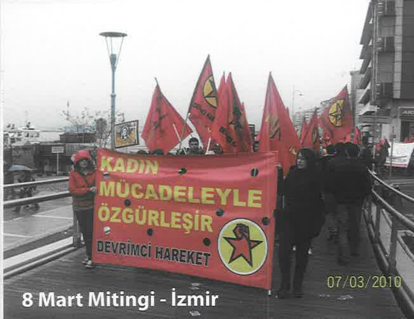
8 Mart Mitingi - İzmir