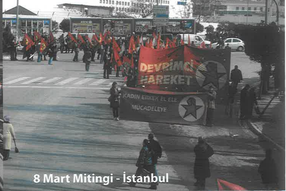
8 Mart Mitingi - İstanbul