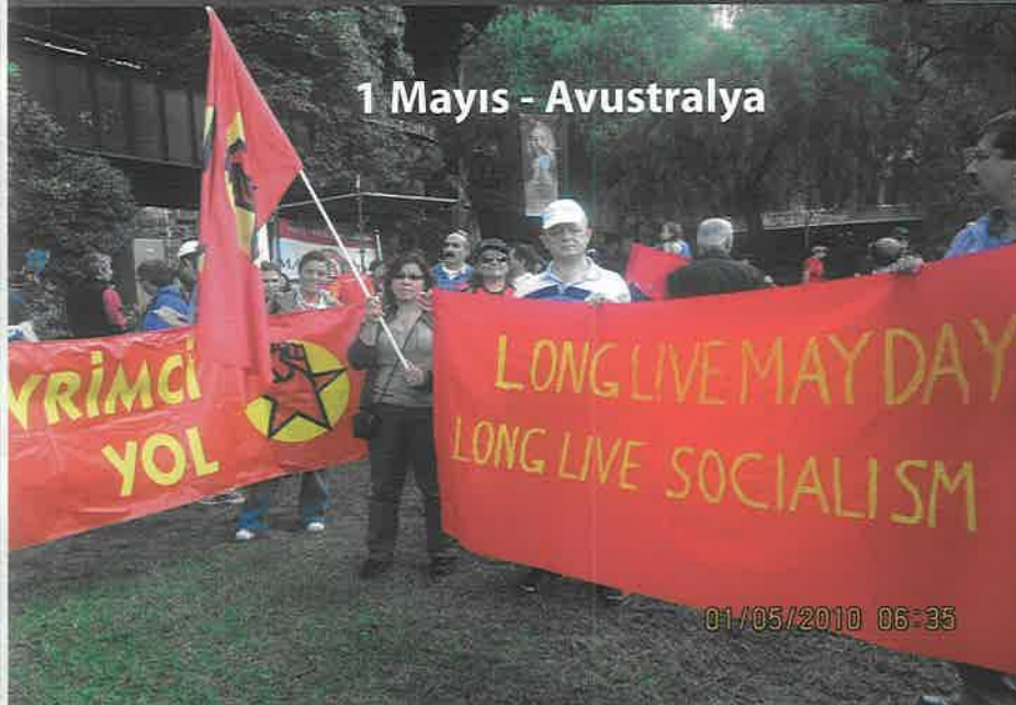
1 Mayıs - Avustralya