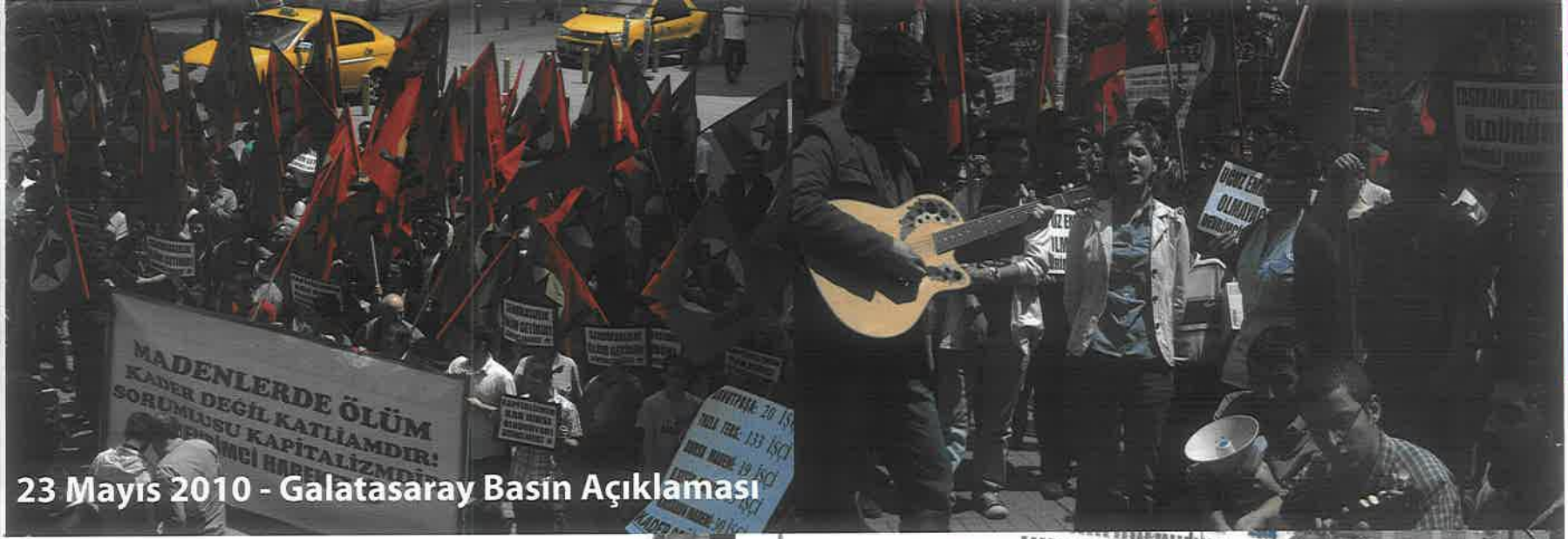
23 Mayıs 2010 - Galatasaray Basın Açıklaması