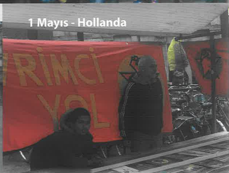
1 Mayıs - Hollanda