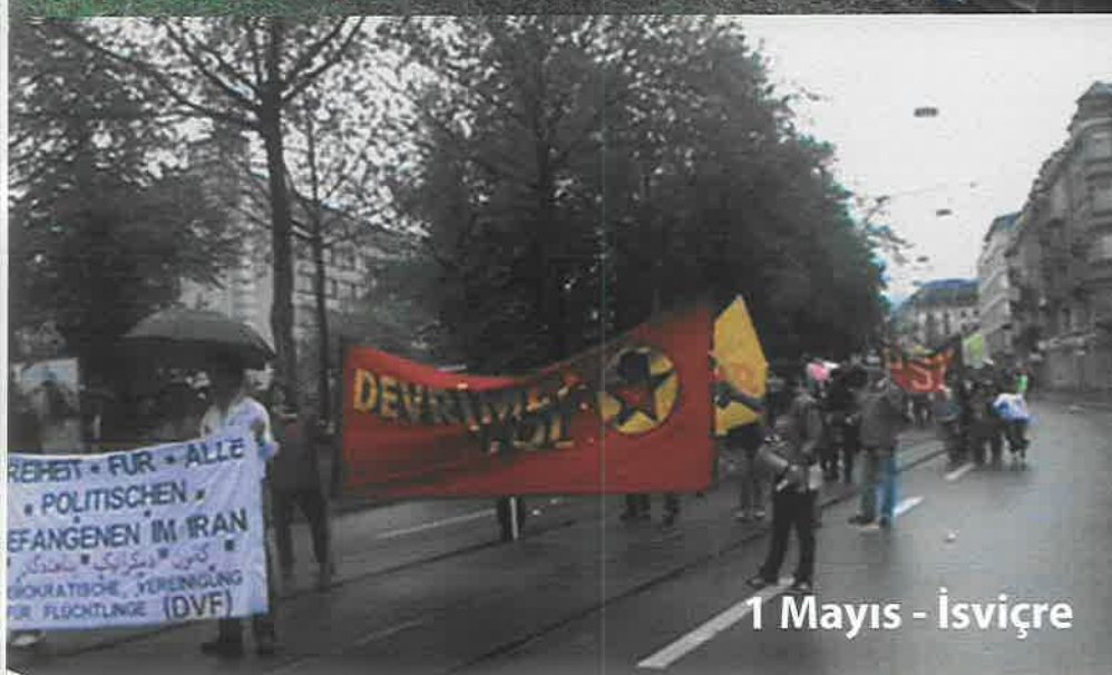
1 Mayıs - İsviçre