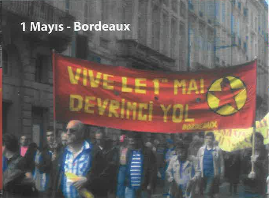
1 Mayıs - Bordeaux