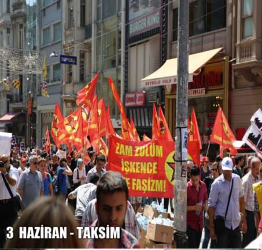
3 HAZİRAN - TAKSİM