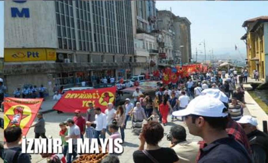
İZMİR 1 MAYIS