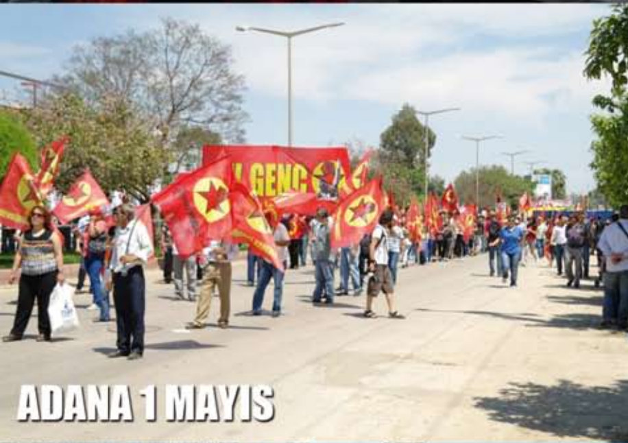
ADANA 1 MAYIS