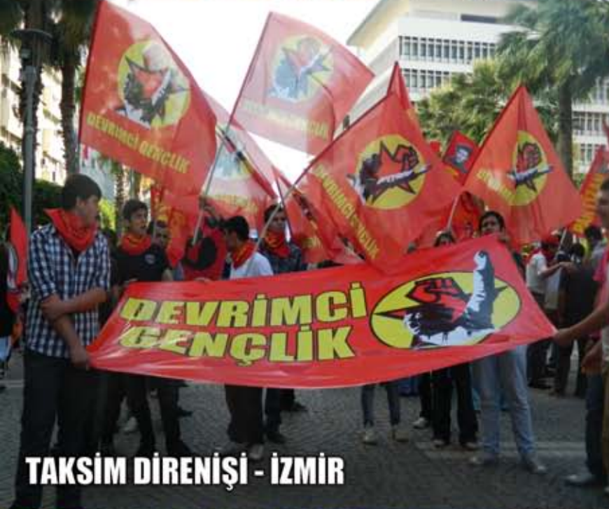
TAKSİM DİRENİŞİ - İZMİR