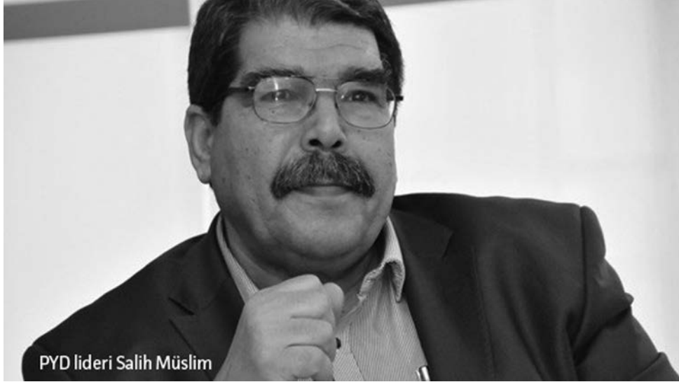
PYD lideri Salih Müslim

Kimlik paradigmasının öngördüğü kimlik demokrasininin, bugün Asya'dan Afrika'ya, Balkanlardan Ortadoğu'ya kadar hemen her coğrafyada emperyalizmin halklara ait her zenginliği(emek ve kaynak da-