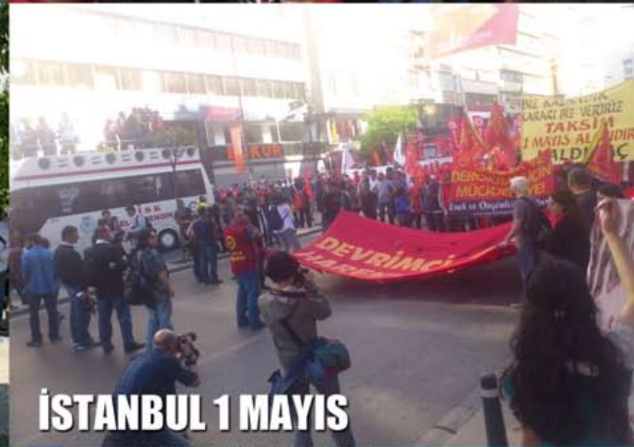
İSTANBUL 1 MAYIS