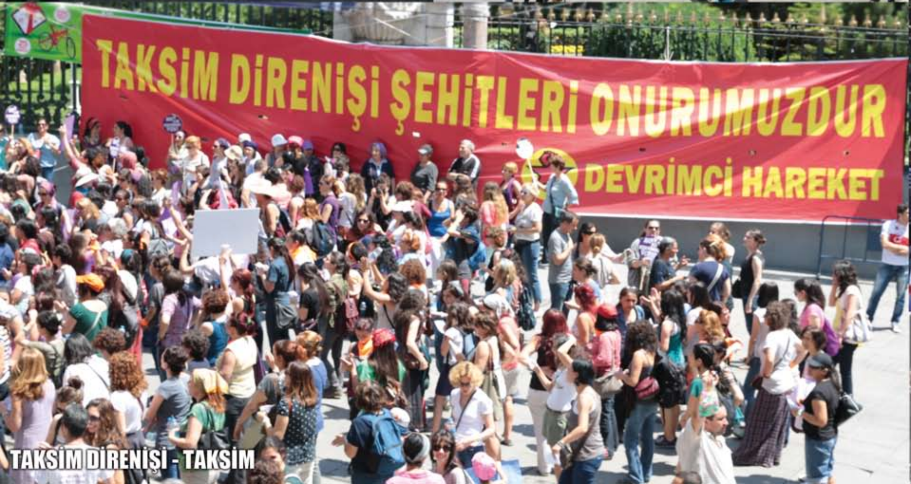
TAKSİM DİRENİŞİ - TAKSİM