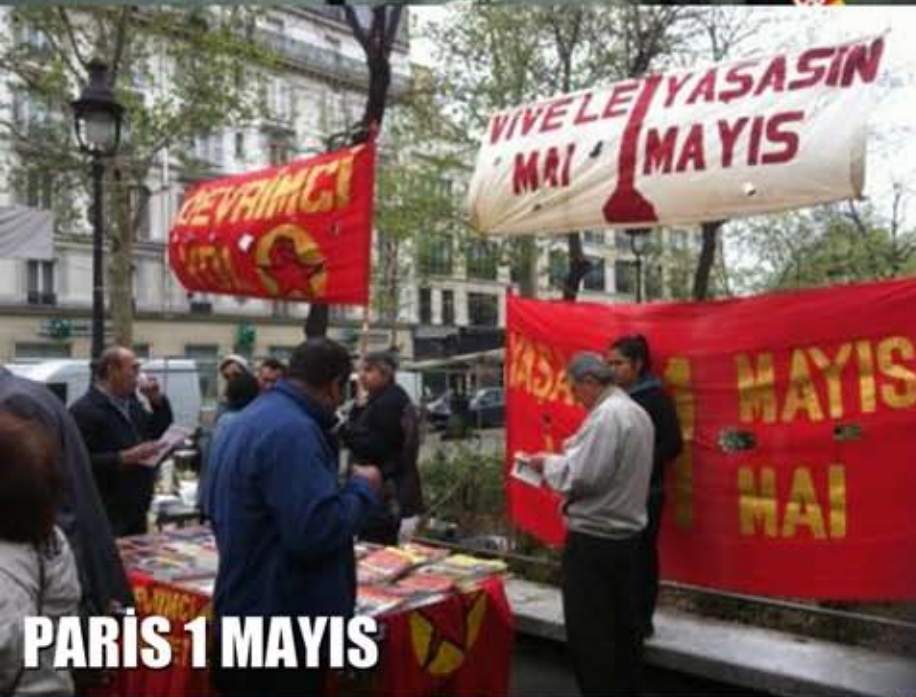
PARİS 1 MAYIS