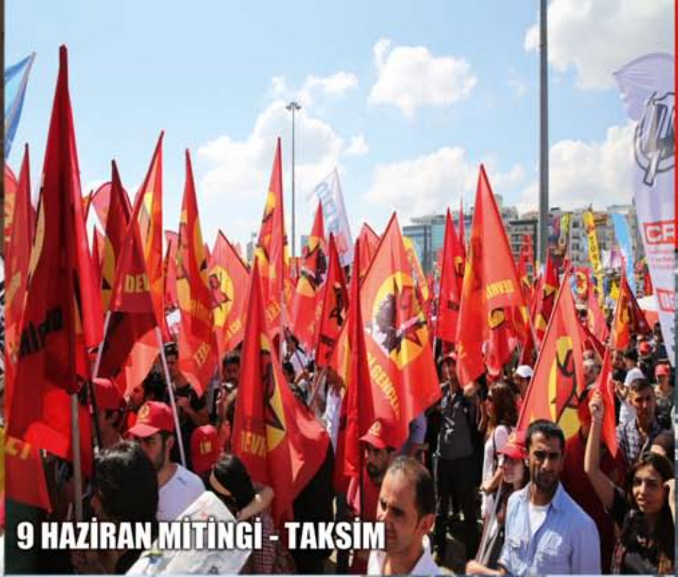
9 HAZİRAN MİTINGİ - TAKSİM