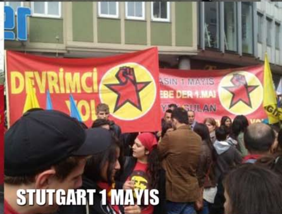
STUTGART 1 MAYIS