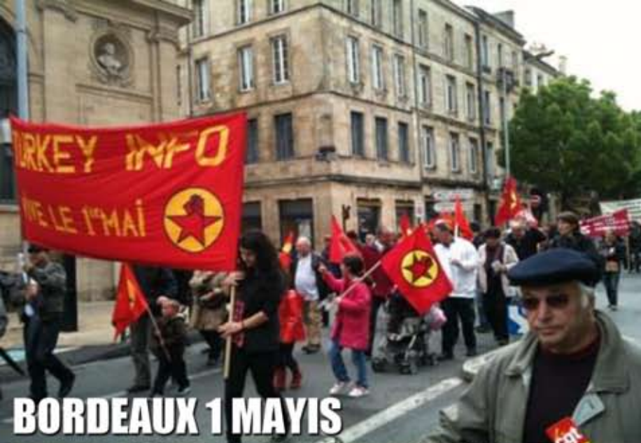
BORDEAUX 1 MAYIS