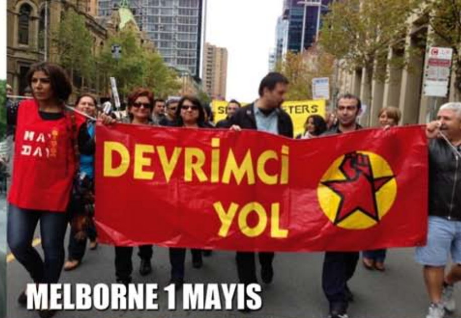
MELBORNE 1 MAYIS