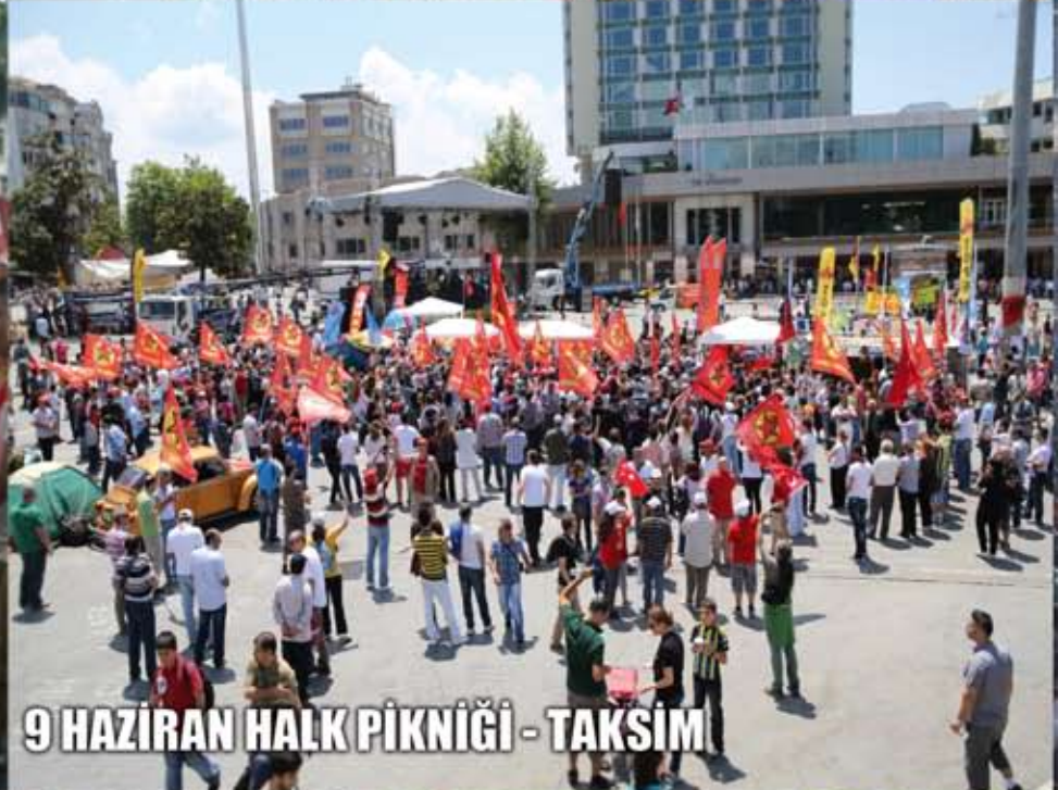
9 HAZİRAN HALK PİKNIĞI - TAKSİM