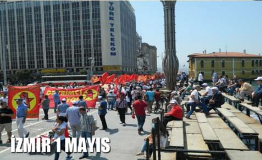
İZMİR 1 MAYIS