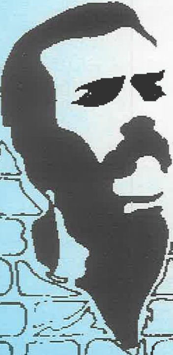
HIDIR ASLAN (25 Ekim 1984)

Ey YOL'umuzun ak alınlı çocukları Ey göğümüzün gönüllü yıldızları Bugünün insansızlığında yeri göğü sađarak arıyoruz sizleri Adınızla anılan yolda ne sizi ne de YOL'umuzu anlamayanlar sisteme geri döndüler Devrimi, güzelliđi ve şafađın gözbebekleriyle tanışmayı hafife alanlar da bugün aramızda deđiller Ama biz biliyoruz ki yoldaşlaşan gönüllerde zaman aşımı olmaz Dün olduđu gibi bugün de YOL'umuzun işaret fişekisiniz