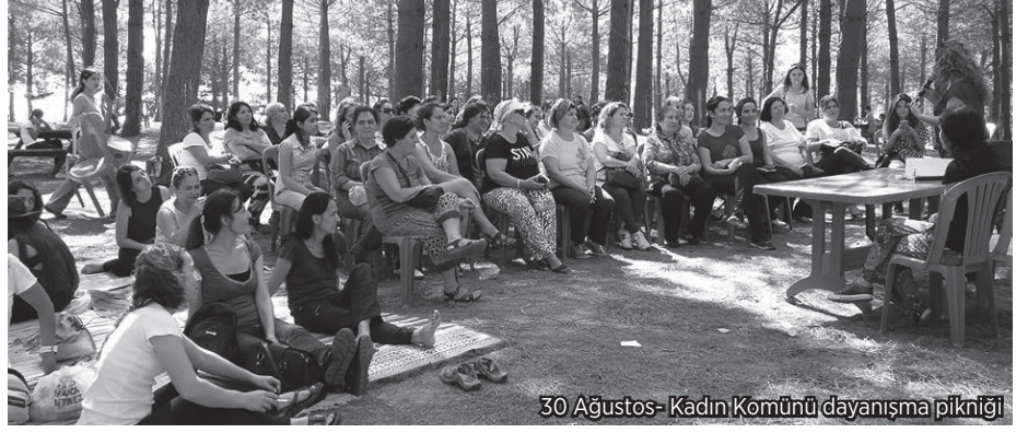
30 Ağustos- Kadın Komünü dayanışma pikniği